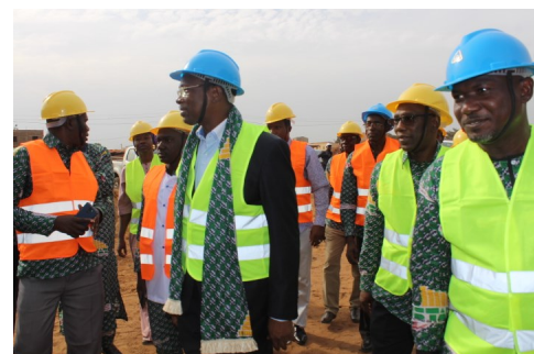
Visite du nouveau siège de l'INSTAT en construction

d'activités des entreprises exerçant sur le territoire national et de dresser, pour les besoins de politiques de décentralisation au Mali, des profils sectoriels des régions.