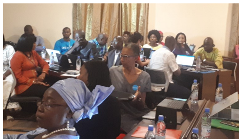
DRPSIAP-Sikasso Participants Atelier de Moment de Réflexion Stratégique (MSR)

Avec un meilleur usage de bonnes statistiques, on peut s'attendre à de bons résultats en matière de développement durable.