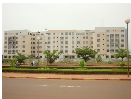
Ministère de l'Economie et des Finances (MEF)

La Gestion axée sur les Résultats (GAR) est l'instrument sur lequel s'appuient l'Institut National de la Statistique et ses démembrements en vue d'atteindre les objectifs du Système Statistique National du Mali.