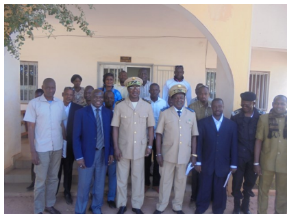
Visite de prise de contact du nouveau Gouverneur le Général Sidi Alhassane TOURE à la DRPSIAP de Mopti

Le développement durable nécessite des statistiques sectorielles et locales appropriées.