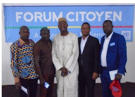
DRPSIAP-Mopti Rapportage au forum CITOYEN

La commune est appelée à renforcer ses propres capacités de gestion municipale, d'organisation des acteurs et de programmation à long terme de la vie de la commune afin de jouer pleinement son rôle de maître d'ouvrage de la relance de l'économie locale.