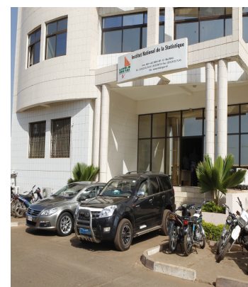
Façade "Entrée" de l'Institut National de la Statistique

Au titre des publications : L'INSTAT a produit les publications suivantes courant 1er trimestre 2019 :