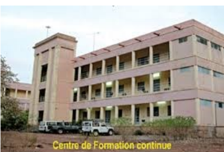
Institut Polytechnique Rural de Formation et de Recherche Appliquée de Katibougou

tions d'accès aux données produites par l'INSTAT, ainsi que sa relation avec la structure ? « Acceptable », apprécie-t-il. Pour l'essentiel des cas, ces données sont utilisées par le chercheur « à titre analytique pour comparer des situations dans le temps et/ou dans l'espace ». « J'ai eu à utiliser des données de l'INSTAT pour redéfinir ou repositionner une intervention nutritionnelle ciblée