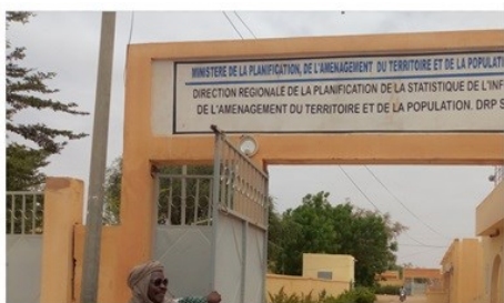
DRPSIAP de Gao

Le développement durable nécessite des statistiques sectorielles et locales appropriées.