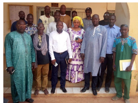
DRPSIAP-Mopti Visite de terrain de la commission PURD

La commune est appelée à renforcer ses propres capacités de gestion municipale, d'organisation des acteurs et de programmation à long terme de la vie de la commune afin de jouer pleinement son rôle de maître d'ouvrage de la relance de l'économie locale.