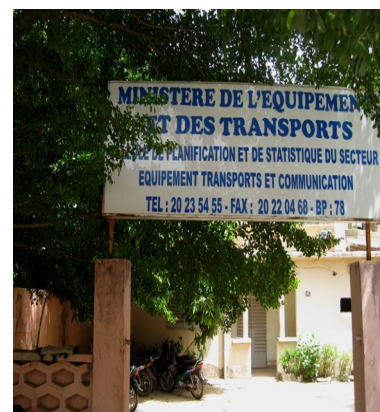
CPS Secteur Equipement, Transport et Communication