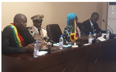
DRPSIAP-Sikasso Cérémonie d'ouverture Atelier de Moment de Réflexion Stratégique (MSR)

• Elle a également participé à Sikasso à la concertation sur les Axes d'Intervention du Conseil Régional pour la période 2019-2022. Financé par l'Etat et les PTF, l'objectif est d'échanger sur les Axes d'Intervention du Conseil Régional.