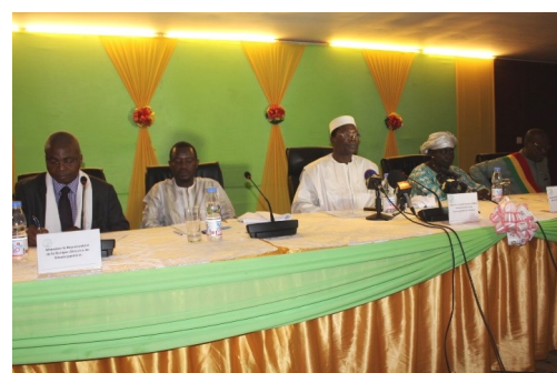
Cérémonie solennelle de lancement du RGUE

Seront visées les petites, moyennes et grandes unités de production, aussi bien du secteur public que privé, du formel et de l'informel.