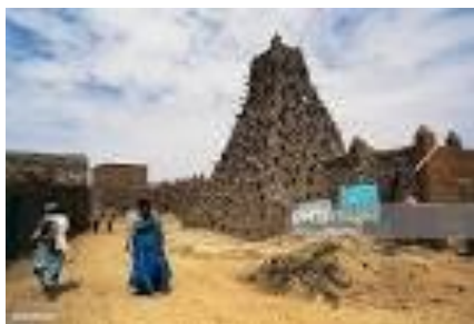
DRPSIAP de Tombouctou

Les bonnes statistiques sont nécessaires pour la réduction de la pauvreté, le suivi des Objectifs du Millénaire pour le Développement, l'efficacité de l'aide et la promotion de la bonne gouvernance.