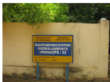
CPS Secteur Coopération et Intégration

Une bonne planification régionale et locale exige toujours l'utilisation des statistiques fiables et à jour.