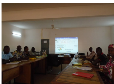
DRPSIAP de Ségou, réunion sur la mercuriale des prix

Une bonne planification régionale et locale exige toujours l'utilisation des statistiques fiables et à jour.