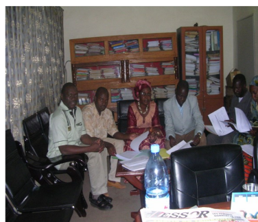
Personnel DRPSIAP District de Bamako

Une bonne planification régionale et locale exige toujours l'utilisation des statistiques fiables et à jour.