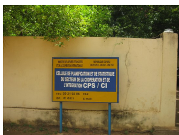
CPS Secteur Coopération et Intégration

Au titre des missions et appuis techniques, la CPS a participé à la formation sur l'analyse secondaire de l'équipe technique des comptes de la sante et rencontre de concertation sur l'utilisation des résultats de recherche pour les prises de décisions: les résultats