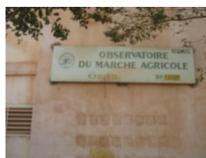
Observatoire du Marché Agricole

Financés par le Programme de Restructuration du Marché Céréalière (PRMC), ces ateliers ont regroupé cinquante (50) participants.