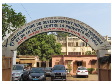
Observatoire du Développement Humain Durable (ODHD)

Une bonne planification régionale et locale exige toujours l'utilisation des statistiques fiables et à jour.