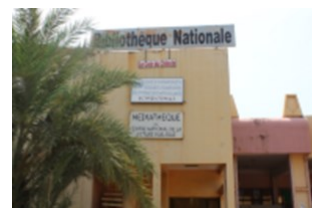
Direction Nationale des Archives

Ces informations sont accessibles sur le site web de