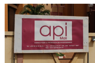
Agence pour la Promotion des Investissements

Ce Bulletin met à disposition les données sur le marché international du riz.