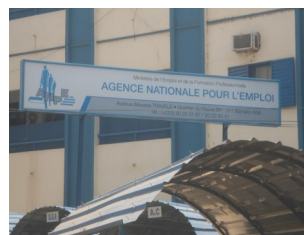
Agence Nationale pour l'Emploi