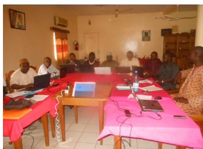
Rencontre de cadrage des services régionaux en charge des questions de planification dans le cadre de l'élaboration des Programmes transfrontaliers de Développement Local des deux espaces Kéniéba - Saraya et Bakel - Kayes

Une bonne planification régionale et locale exige toujours l'utilisation des statistiques fiables et à jour.