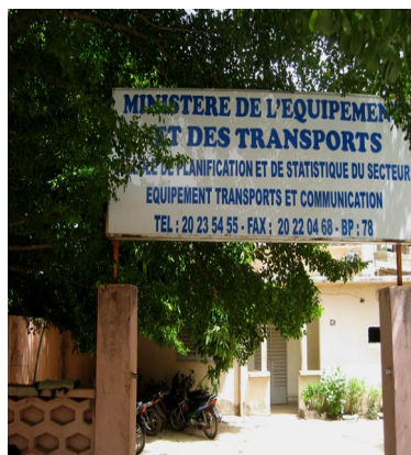
CPS Secteur Equipement, Transport et Communication

Une bonne planification régionale et locale exige toujours l'utilisation des statistiques fiables et à jour.